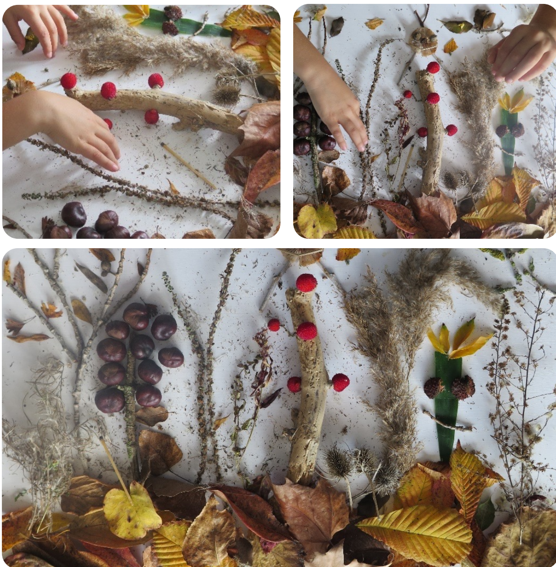
Fotografías de Guerau Forasté

Podéis inventar pequeños argumentos a medida que componéis el cuadro, o bien, una vez terminado, fotografiarlo e intercambiaros vuestras creaciones para contemplarlas y narrativizarlas juntos. Aquí va un ejemplo y algunas preguntas de ayuda para romper el hielo y empezar a imaginar: