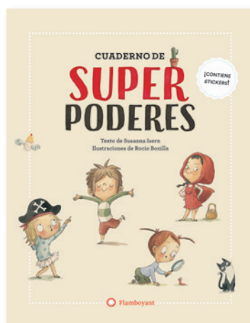
Cuaderno de superpoderes