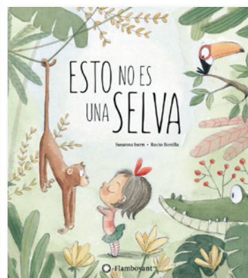
Esto no es una selva