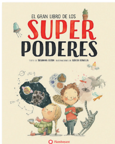
El gran libro de los superpoderes

Si os ha gustado trabajar El gran libro de los supertesoros , aquí tenéis otras obras de las mismas autoras.