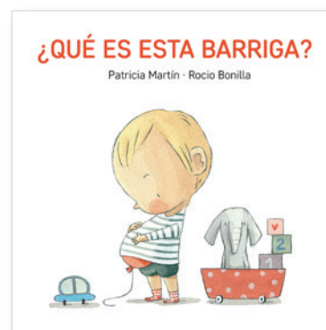
¿Qué es esta barriga?